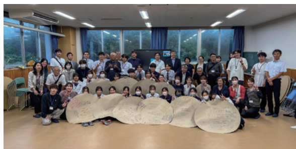
研修会後の集合写真(生徒が持っている段ボールは協議内容を記載したもの)

成果は、生徒・保護者が率直な意見を出し合い形に残すことができたことです。課題としては、離島の交通の便があげられると思います。